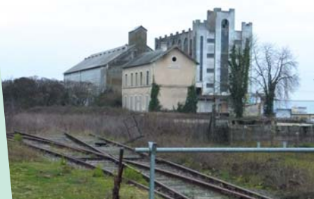
Site des Sables.

Nous avons déjà évoqué les problèmes liés à l'EHPAD des Marronniers (Maison de Retraite) de Chauvigny, qui