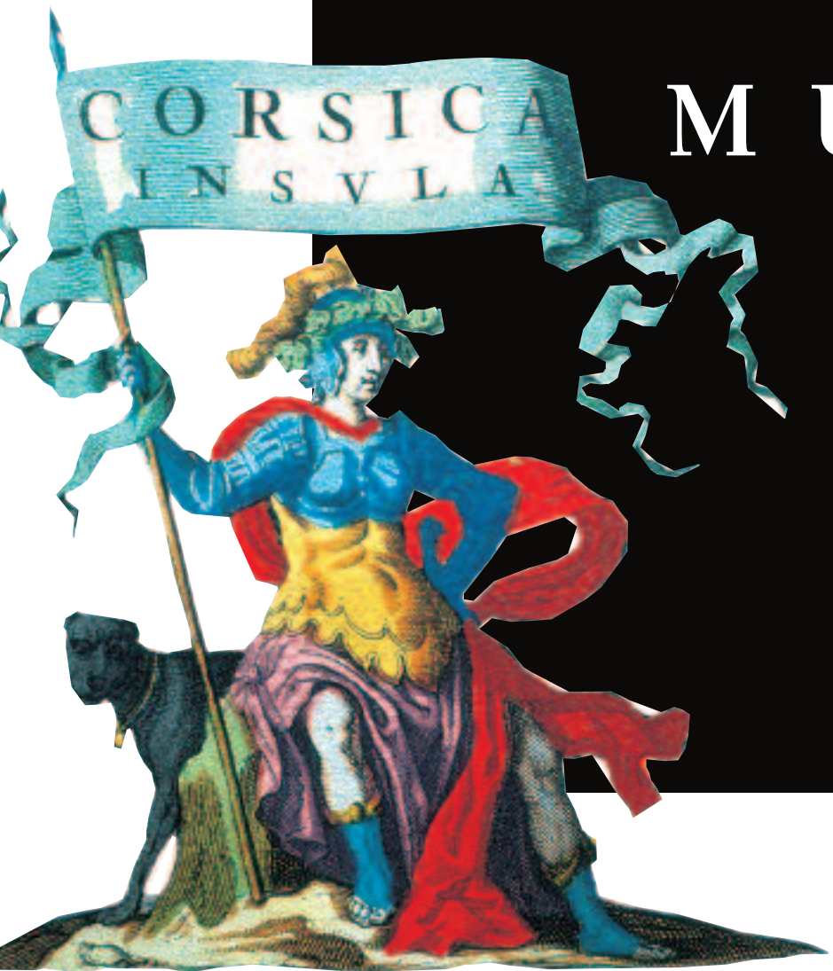
Allégorie de la Corse d'après Cesare Ripa