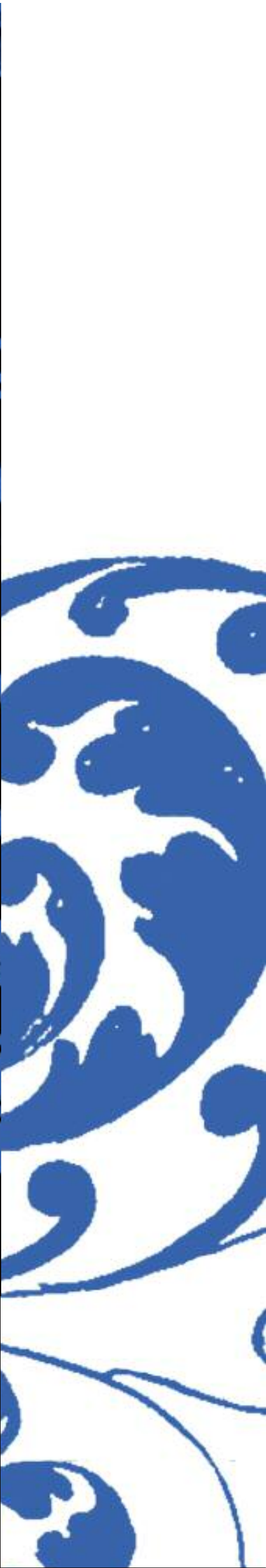
Vue partielle