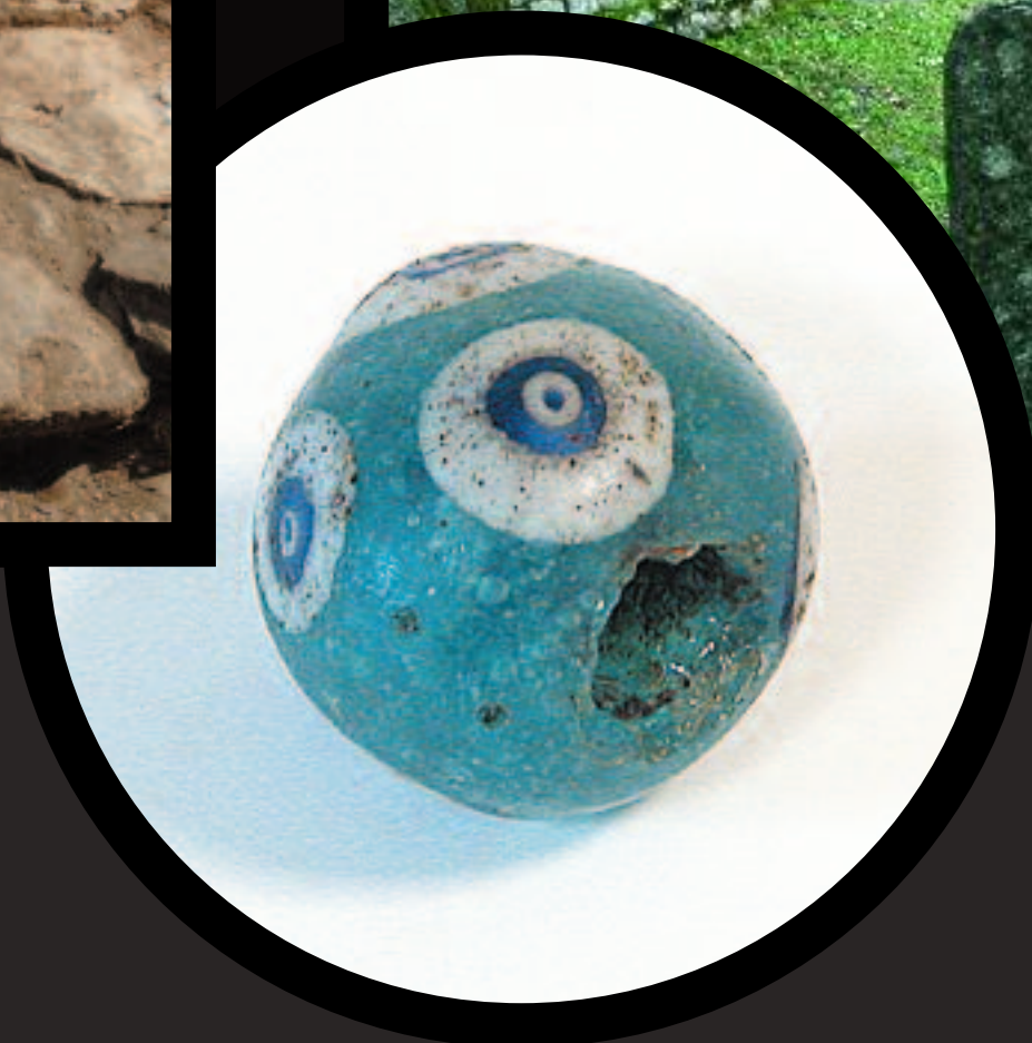
Photo : J.-M. Goyenex Coll. Parcu di Corsica Levie Site de Cucuruzzu U Casteddu

Photo : P. Neri © Collectivité Territoriale de Corse Ajaccio Site Alban Fouilles du baptistère