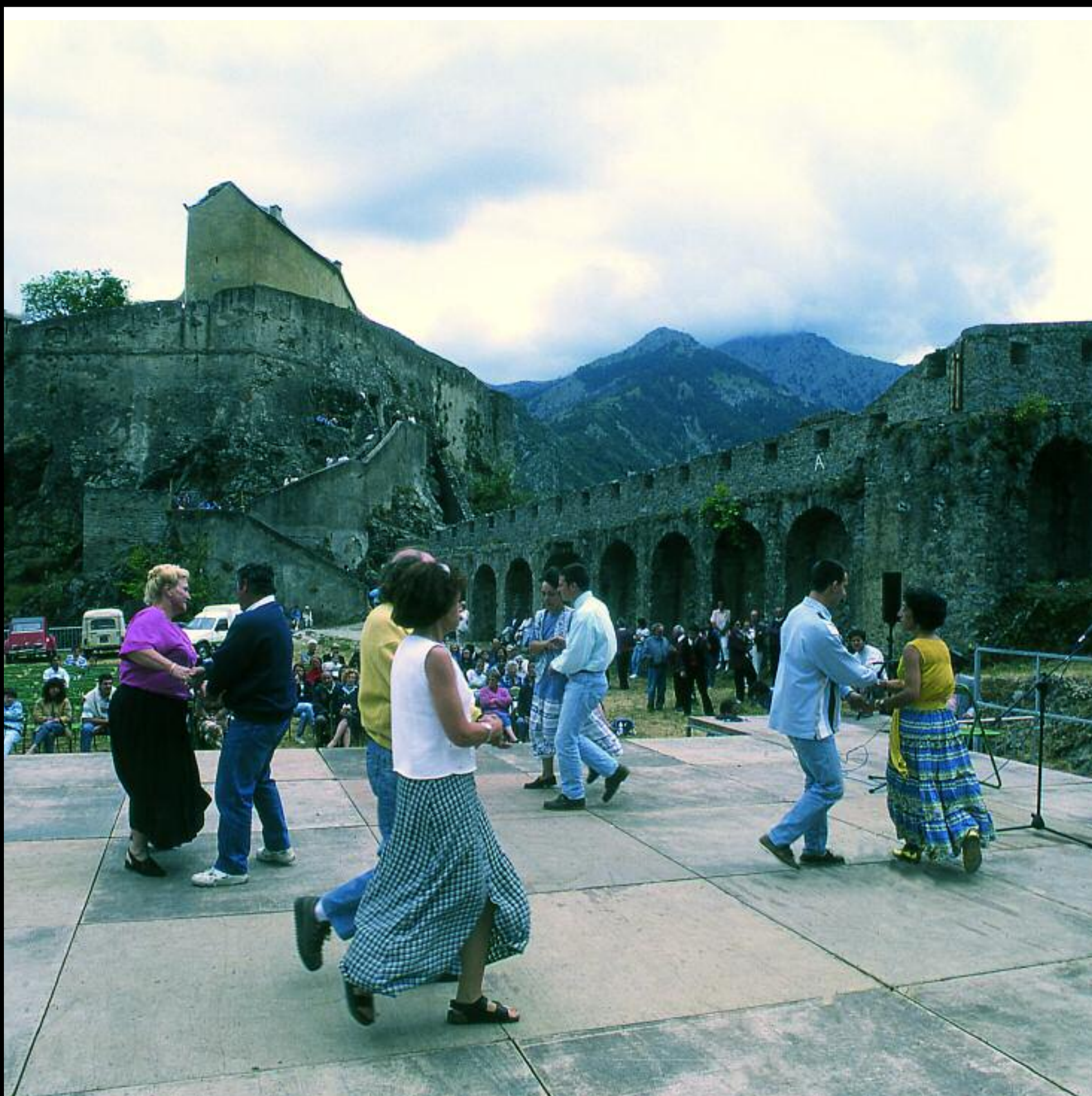
Fête de la San Ghjuvâ : Quadrilles Citadelle de Corte

Atelier pédagogique du Musée de la Corse