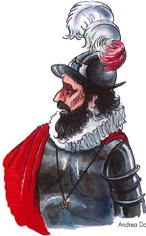
Andrea Doria, grandi amirali ghjinuvesu (1466-1560).

À parta si da u 1511, a Corsica hè sott'à l'autorità ghjinuvesa di l'Uffiziu di San Ghjorghju. Iss'uffiziu metti in anda una pulitica capitalista è culuniali di missa in valori di l'Isula. Ma i tempa di guerra ùn sò finiti, è un antru priculu trimendu affacca à parta si da i principii di u sidicesimu seculu : i Turchi di Barbaria.